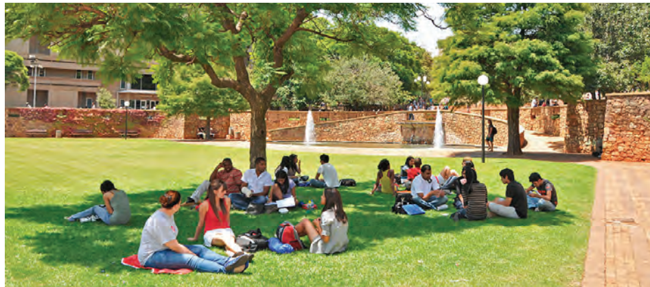
● En el campus de la Universidad de Witwatersrand.

en un momento en el que México y Sudáfrica celebran 25 años de relaciones diplomáticas.