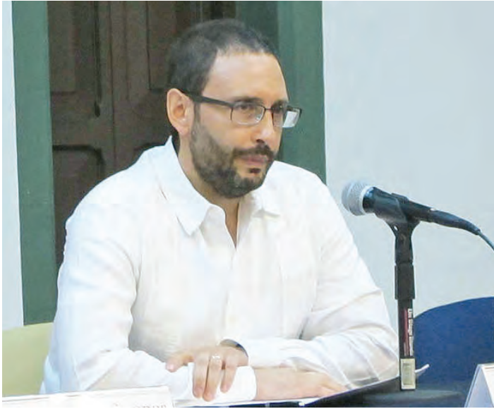
• El director del Centro.