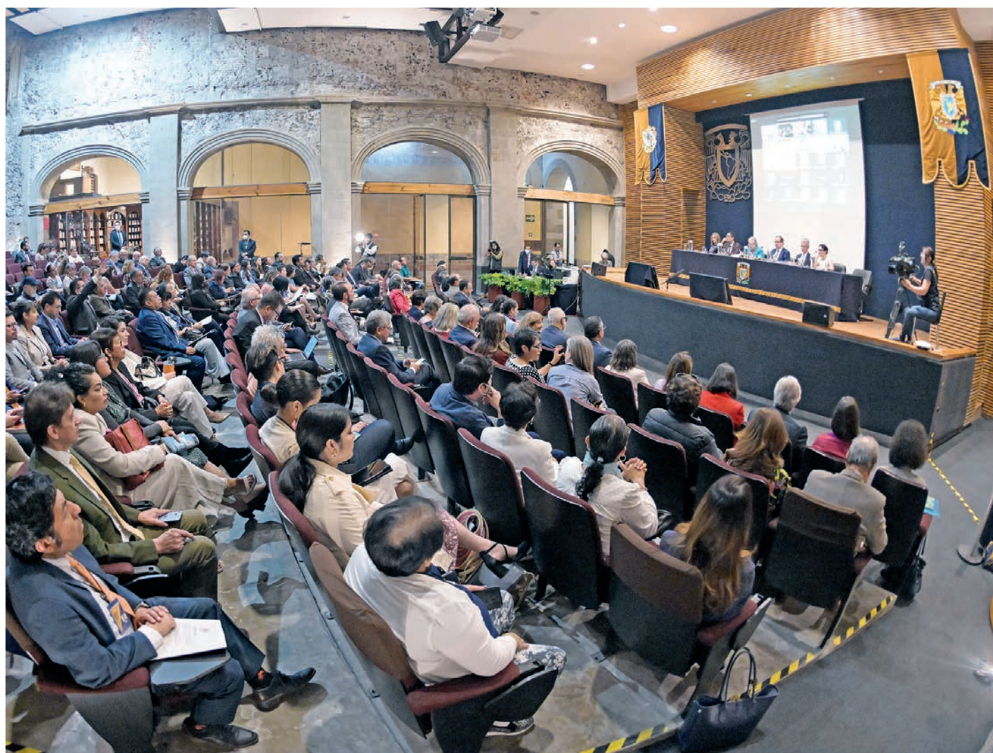
● Imagen de la anterior sesión del Consejo, realizada en marzo.

Además, el CU tomará protesta a nuevas consejeras y consejeros; estudiará otorgar la Medalla Gabino Barreda, en forma extemporánea, a alumnas y alumnos de licenciatura; conocerá informes de las comisiones especiales Electoral y de Seguridad, así como del Comité de Transparencia correspondiente al año 2023, entre otros asuntos relevantes. g