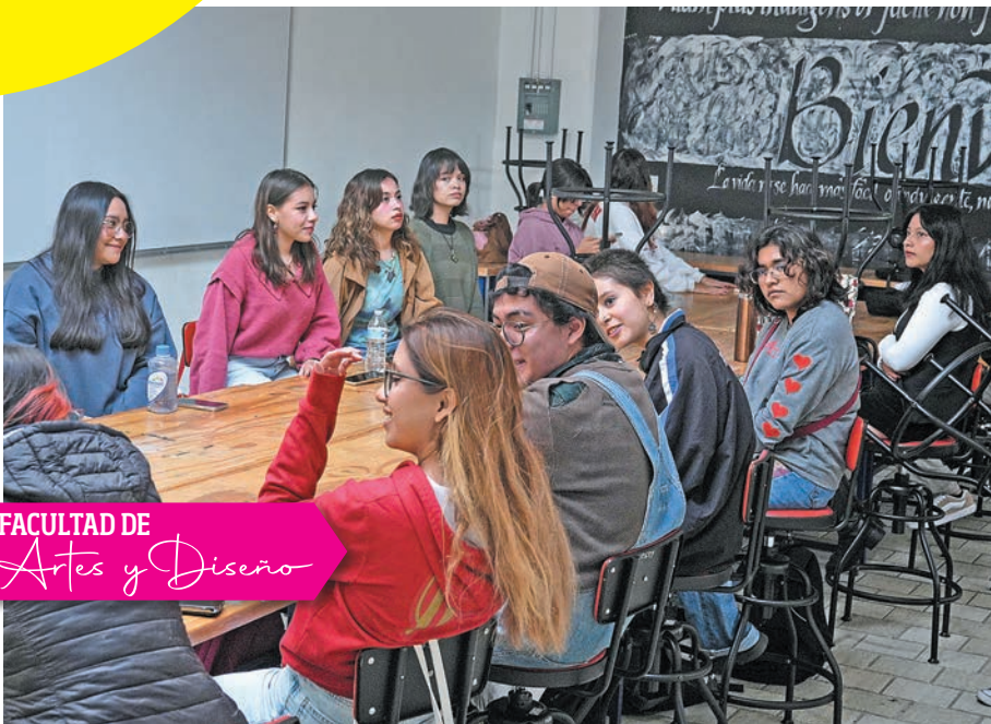
FACULTAD DE Artes y Diseño