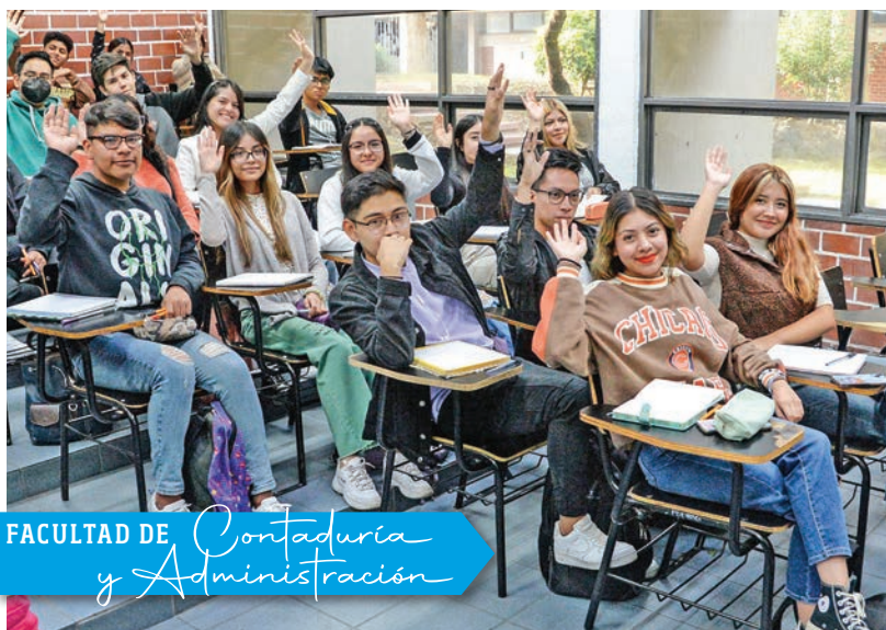
FACULTAD DE Contaduría y Administración