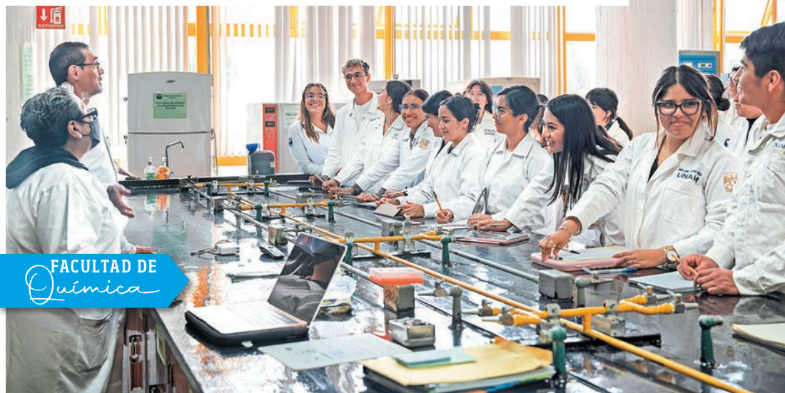
FACULTAD DE Química