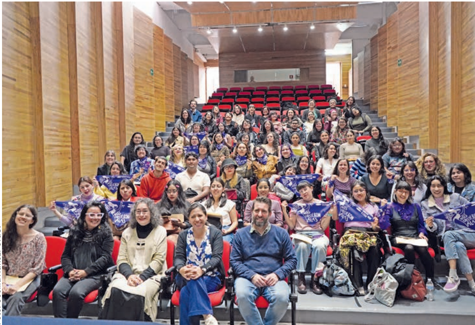
● Integrantes de la edición 2024 de la Beca Educando para la Igualdad.