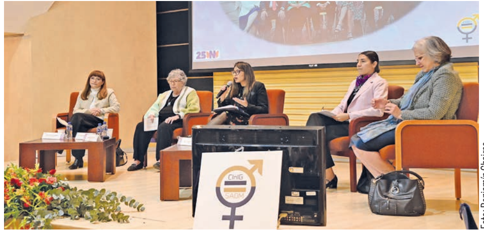
● Académicas analizan los retos de la sociedad frente a la equidad de género.